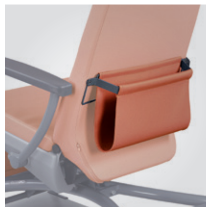
Bolsillo de almacenamiento