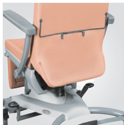
Soporte para bolsa de orina