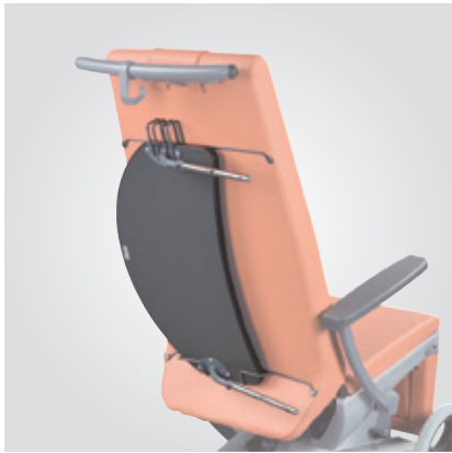
Soporte para la mesa