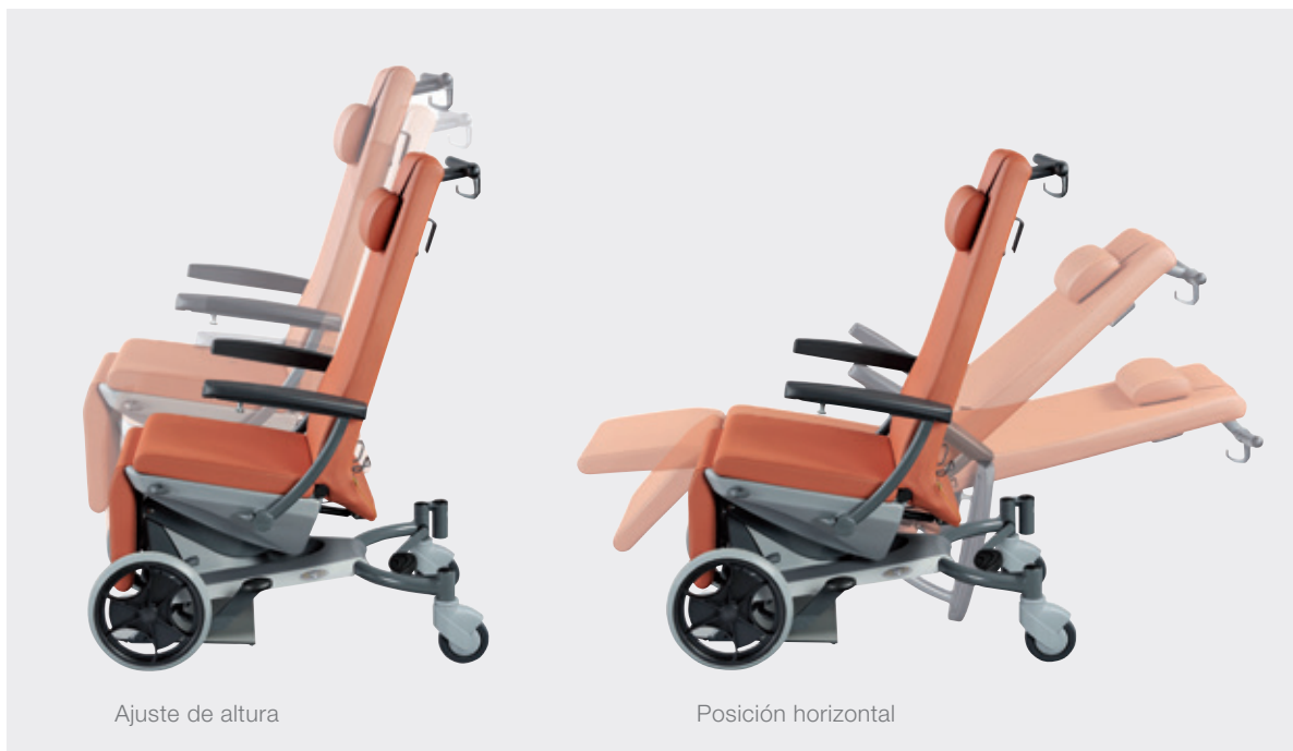
Ajuste de altura

Opciones de posicionamiento para brindar la máxima comodidad al cliente