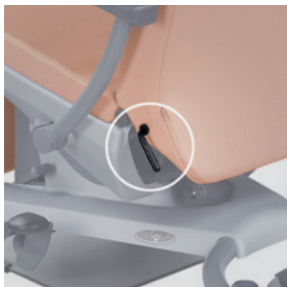
Ajuste independiente del respaldo