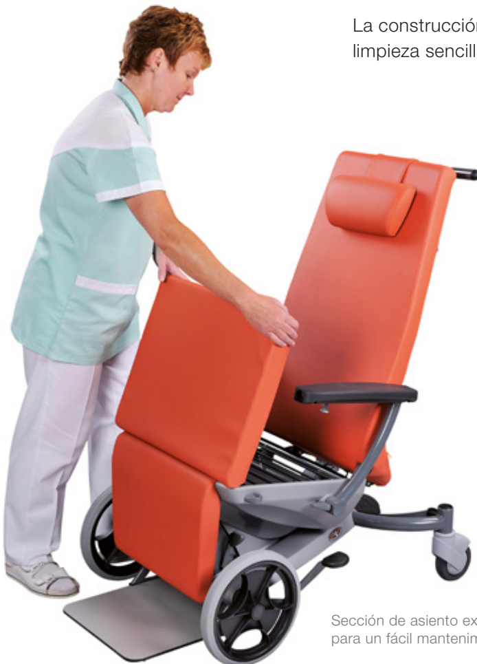
Sección de asiento extraíble para un fácil mantenimiento.

La construcción y los materiales utilizados permiten una limpieza sencilla y sin esfuerzo.