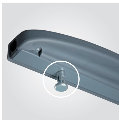
Bloqueo de seguridad de la mesa