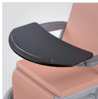
Mesa con barrera de seguridad