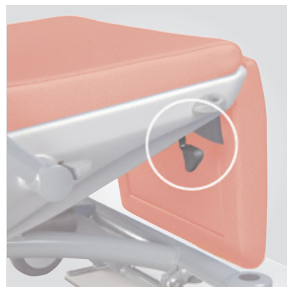
Ajuste independiente del reposapiernas