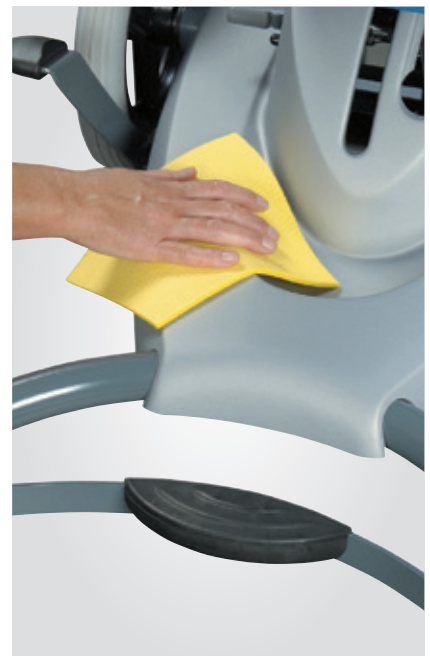
Limpieza fácil y rápida con productos de limpieza y desinfección habituales.