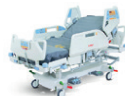
Multicare, Multicare LE