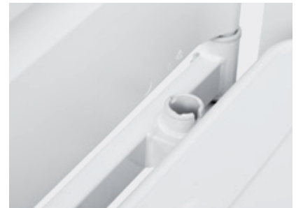
Soporte para accesorios