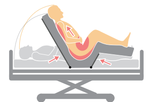
Una plataforma de colchón habitual