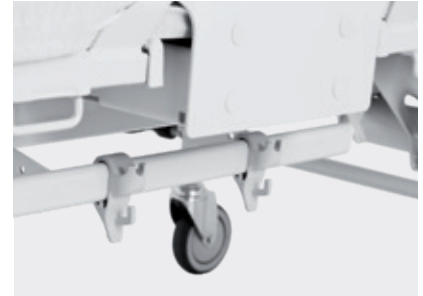
Barra de accesorios