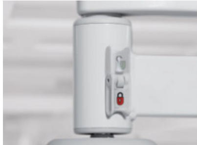
Bloqueo de la cabecera y piecera