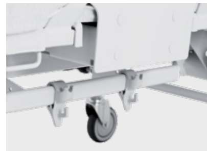
Lišta na příslušenství