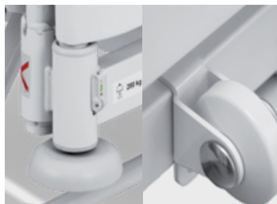
Rohová ochranná kolečka horizontální a přídavná vertikální