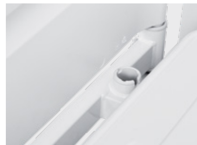
Pouzdra na příslušenství