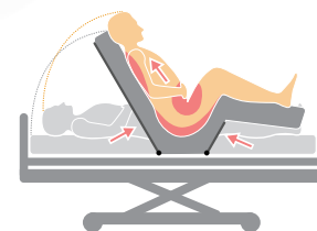
Standardní ložná plocha