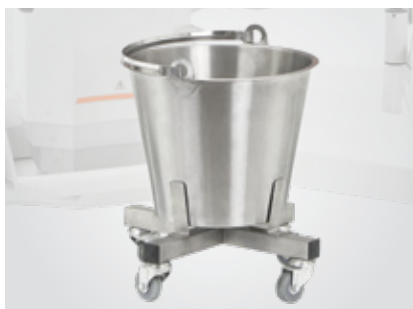
Seau à placenta sur roulettes