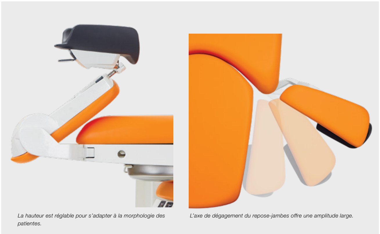
La hauteur est réglable pour s'adapter à la morphologie des patientes.