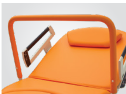
Barre de suspension