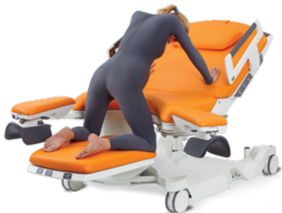
A genoux en appui sur bras