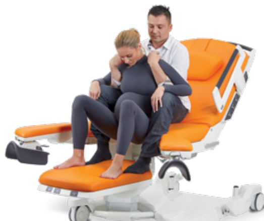
Semi-assise avec l'aide de son partenaire