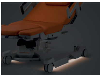
Veilleuse de nuit