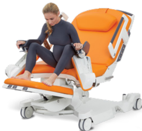
Semi-assise en appui sur les repose-jambes