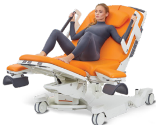
Semi couchée avec les pieds sur la section jambière