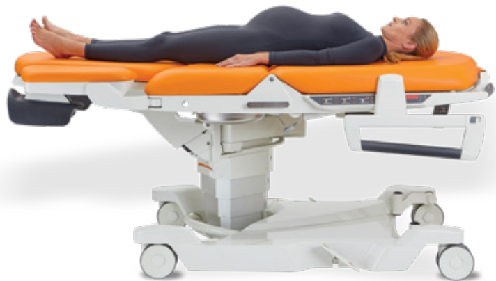
Remise à plat d'urgence du relève buste