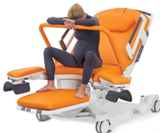
Assise, accoudée à la barre