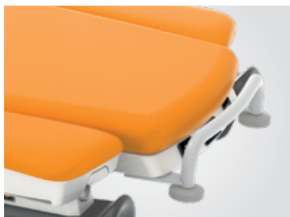
Barre de brancardage