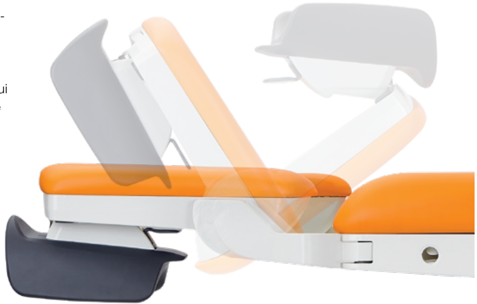
Réglage rapide des repose-jambes.

L'amplitude des axes de positionnement des repose-jambes permet à l'équipe soignante de répondre très rapidement et efficacement aux différentes situations qui peuvent se produire lors de l'accouchement.