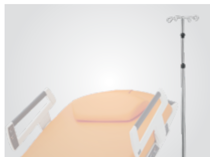
Tige à perfusion