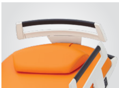
Tête de lit amovible