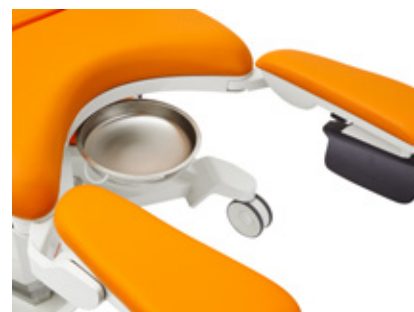
Sliding stainless catch basin 4.5l