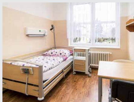
Základním vybavením pokojů jsou lůžka Altura Thema.