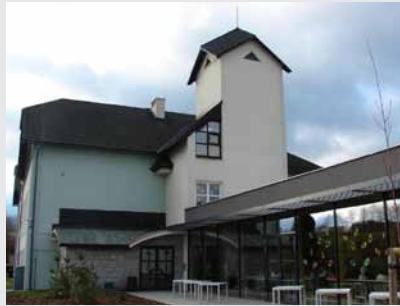
Moderní přístavba Domova pro seniory Jeseník

Na konci loňského roku dostaly sociální služby v Jeseníku zcela novou podobu. Zdejší obyvatelé najdou v nově otevřeném Centru sociálních služeb Jeseník nejen chráněné bydlení (stejně jako v někdejších Pensionu pro seniory), ale také denní stacionář a především domov pro seniory vybavený moderními pečovatelskými lůžky Sentida.