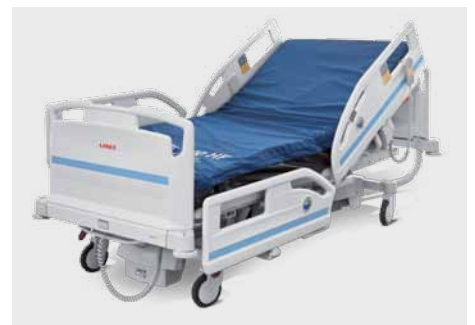
CLINICARE 100 HF