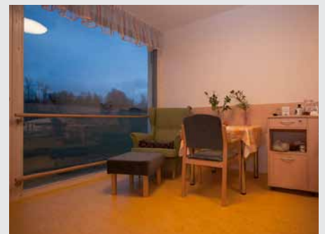
Důraz je kladen na přirozené světlo a propojení s přírodou.

O novou nabídku sociálních služeb je velký zájem, první obyvatelé domova pro seniory se sem nastěhovali už v listopadu loňského roku a v současné době už se jeho kapacita zcela naplnila.