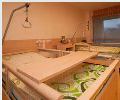
Pokoje jsou vybaveny komfortními lůžky Sentida.

Nová budova „A“ byla postavena v letech 2014–15 a pojetím klade velký důraz na prostornost, dostatek světla a maximální propojení s okolní přírodou. Proto jsou pokoje a další místnosti vybaveny velkými okenními plochami, podle potřeby stíněnými elektricky ovládanými venkovními roletami. Moderní technologie a kvalita zpracování jsou podle starosty města Jeseník, které je zřizovatelem Centra sociálních služeb, celkově typické pro nedávno skončenou stavbu.