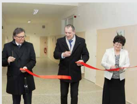
Slavnostní otevření oddělení sociálních lůžek proběhlo v březnu.

Základní nemocniční odbornosti tvoří chirurgie, interna, gynekologie a porodnictví, oddělení dětské a oddělení anestézie, resuscitační i intenzivní péče. Mezi speciálními odbornostmi s nadregionální působností patří vedle ortopedie také urologie, oční, TRN, neurologie, onkologie, kožní a oddělení dialýzy.