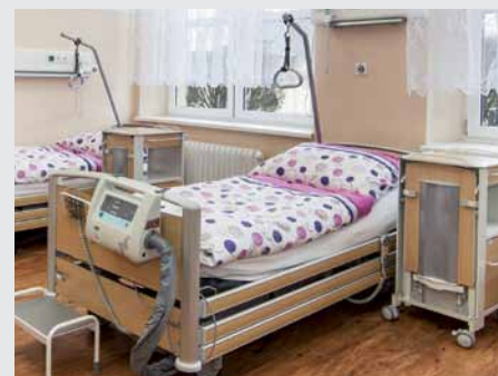
Některá lůžka jsou doplněna aktivní antidekubitní matrací Virtuoso.