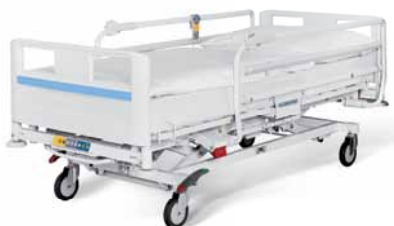
Eleganza 1 ve variantě pro zdravotnictví