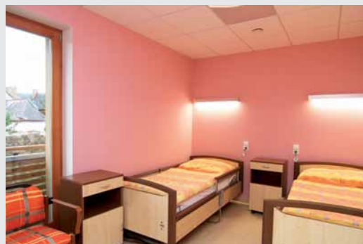
Pokoje jsou vybaveny nízkými lůžky Sentida.

S péčí o klienty tu personálu pomáhají nízká,