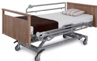
Eleganza 1 ve variantě pro pečovatelsví

Lůžko Eleganza 1 může být vybaveno dvěma druhy postranic. Plastové dělené postranice vynikají moderním designem a výbornou čistitelností. Jednoduché sklopné postranice jsou unikátní díky ergonomicky umístěnému odjišťovacímu mechanismu – práce sester je tím výrazně usnadněna.