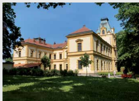
Domov Alfreda Skeneho v Pavlovicích u Přerova má k dispozici 48 podložek.

Pro více informací kontaktujte zákaznické centrum LINETu na tel.: 312 576 400 nebo emailu: obchodcr@linet.cz nebo požádejte svého regionálního zástupce o praktickou ukázkou evakuace s podložkou. Instruktažní video naleznete na: www.youtube.com/LinetMarketing