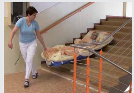
Podložky umožňují snadnou evakuaci ze schodů.