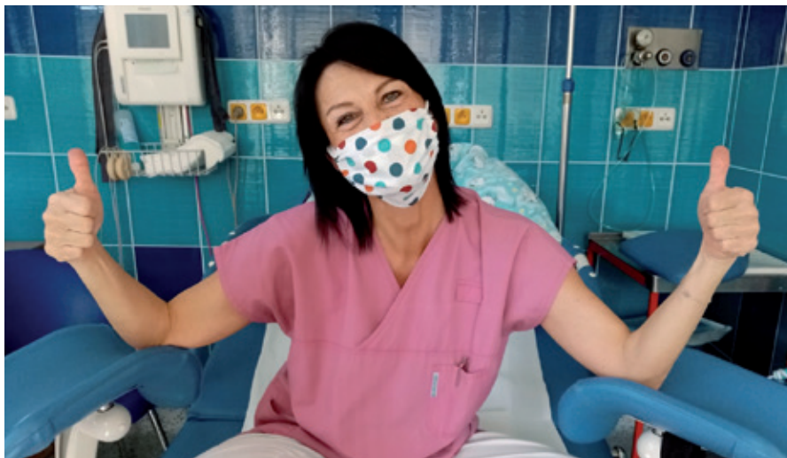
Optimismus neztrácí ani v době Covid-19

Mám dar řeči a také věk a zkušenosti, takže mi ženy věří. Jsem také hodně kontaktní a rodiček se dotýkám v oblasti kříže, která je nejsenzitivnější. Podporuji je také pohlazením, dýchám s nimi a pozitivně je motivuji i v hlasových projevech. Zkrátka aby věděly, že ve dvou se to lépe táhne. Dávám jim hlavně pocit bezpečí, pochopení, ukazuji jim, že tu jsem pro ně. Snažím se také do porodu vtáhnout i tatínky, protože i oni chtějí být u porodu užiteční, tak jim radím, jak pomoci své ženě, jsem jim takovým prostředníkem. A je vidět, že to funguje, protože mám od novopečených tatínků velmi pozitivní ohlasy. Mám radost, když vidím, jaký smysl má naše práce.