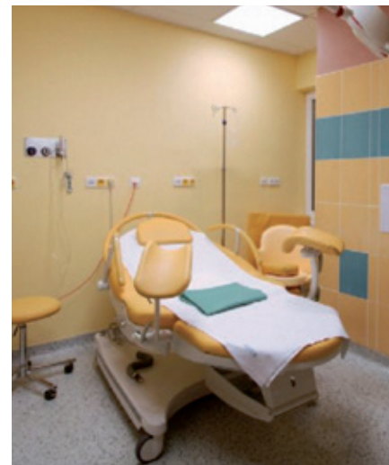
Jeden z porodních boxů