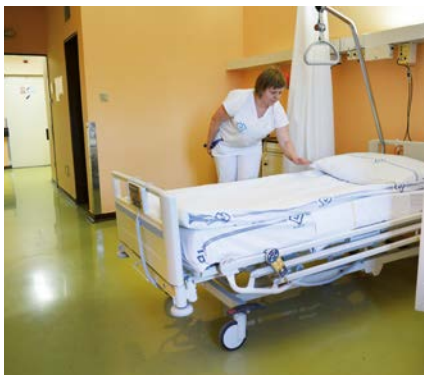
Sanitářka doladuje poslední detaily