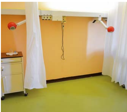
Místo určeno. Vše je připraveno