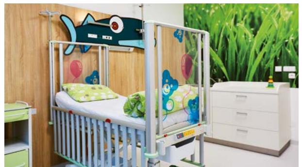
Detské lôžko TOM 2 dotvára dizajnové detské izby