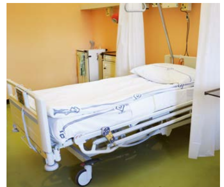
Nová Eleganza 1 je ready. Bude sloužit pacientům i sestřám