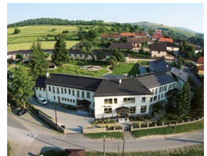
Dominik n.o. vo Veľkej Lehote