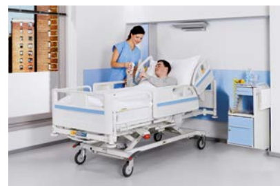
Eleganza 1 Univerzální lůžko