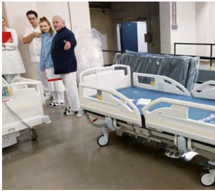
Následuje rozbalení a vyzkoušení funkčnosti