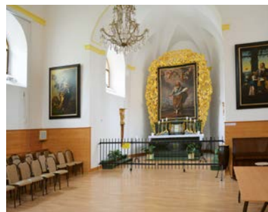
Turistickým magnetem je především zámecká kaple

Na toto bychom se museli zeptat našich uživatelů služeb. Jak jsem řekl, naše klientela a služby jsou velmi různorodé. Chceme, aby naši klienti ve školním věku nejraději chodili do školy a po škole trávili čas jako děti, tedy hrou s ostatními dětmi. Věřím, že naši dospělí rádi navštěvují naše centra pro pracovní aktivity, které si zvolili, anebo chodí do zaměstnání, pokud mají možnost. Oblíbený je například hudební soubor Barbušáci, kde obyvatele domova tráví svůj čas ať již na zkouškách souboru, nebo na vystoupeních mimo domov.