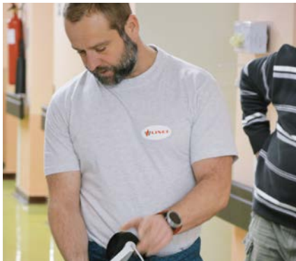
Servisní technik zaškolí personál, vysvětlí všechny funkce a odpoví na dotazy