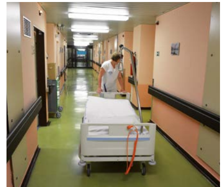
Povlečené a připravené lůžko už očekává nový pacient