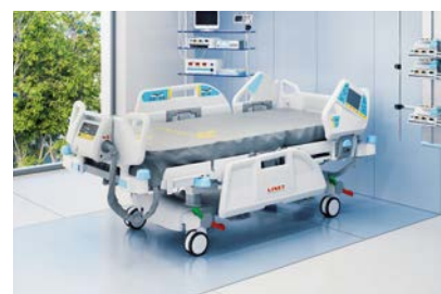
Multicare Lůžko pro intenzivní péči