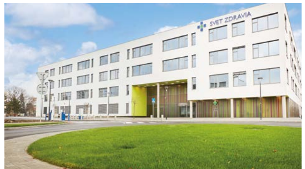
Nemocnica novej generácie v Michalovciach