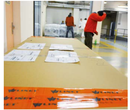
Kromě lůžka je na místě i veškeré příslušenství – matrace, hrazda, triangl a vše ostatní