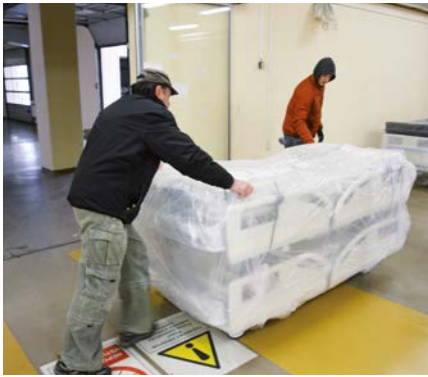
Servisní tým přiváží lůžka v ochranných obalech