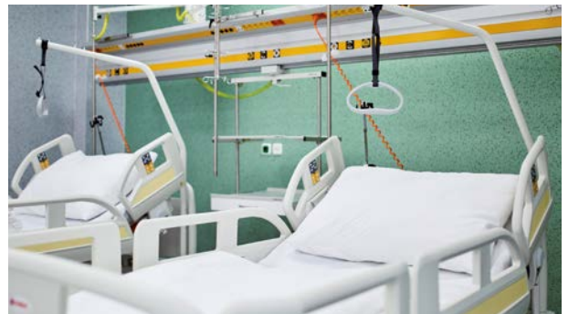
S novými lôžkami z LINETU sú v Michalovciach spokojní

Už samotná prezentácia a zaškolenie o používaní postelí bola na vysokej odbornej úrovni, dodávka bola vybavená korektne a aj po spustení prevádzky nie je problém s komunikáciou a ochotou zo strany spoločnosti Artspect.