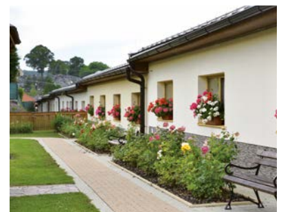
Bezbariérové a príjemné prostredie