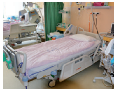
JIP má k dispozici TOP lůžka Multicare.