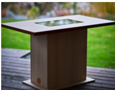
Možnosti provedení senTable® jsou maximálně variabilní.