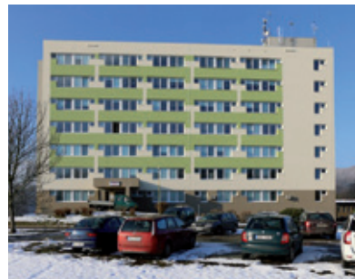
Pavilon Interny se rekonstruoval za plného provozu.

Rozvoj Nemocnice Děčín ale nespočívá pouze v investičních akcích, budování a rekonstrukcích. Zajímavým projektem je velice úzká spolupráce s děčínskou Střední zdravotnickou školou, jejímž studentům nemocnice nabízí zajímavé stipendijní programy.