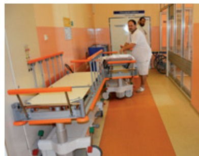
Stretchery Sprint usnadňují transport děčínských pacientů.

Studenti hodnotí tuto praxi velmi pozitivně, už z loňského roku jsme zaznamenali ohlasy, že jim práce v „terénu“ přinesla hodně odborných znalostí a pomohla například při maturitě. Děvčata se k nám hlásí po maturitě do pracovního poměru či na další dohodu při navazujícím studiu. Naše blízká spolupráce se školou tomu určitě napomohla.