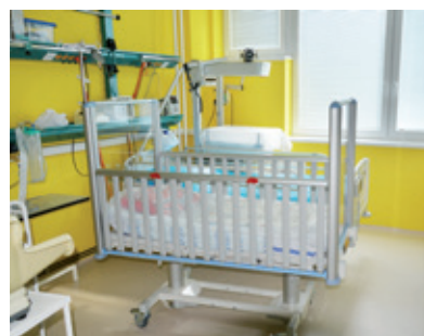
Dětské oddělení je vybaveno moderními lůžky TOM 2.