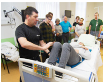
Nácvik manipulace s lektorem.

M oving & Handling se může naučit každý, kdo pracuje s pacientem na lůžku. Jde jen o to, správným způsobem provádět jednotlivé činnosti a zažít si tyto návyky v ošetrovatelské rutině. Kurzy Moving & Handling nyní dostupné i pro české sestry, zdravotnické