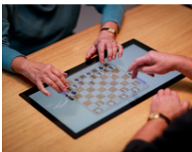
Hry, kvízy, statistiky, jež umožňují trénink krátkodobé a dlouhodobé paměti.

Senioři a online aplikace? Zdá se vám, že to nejde dohromady? senTable® vás přesvědčí, že opak je pravdou. Tento patentovaný interaktivní dotykový stůl je novinkou společnosti LINET a je určený právě seniorům pro jejich zábavu, ale i terapii. Hlavním účelem je aktivizace seniorů a rezidentů v pečovatelských zařízeních, ale má i další funkce ušité na míru domovům pro seniory, nemocnicím, stacionářům, terapeutickým a aktivizačním prostorům nebo pro čekárny v ambulancích.