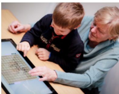
Skvělý pomocník pro aktivizaci i pro volný čas.