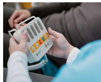
Přehledný ovladač je určený jak pro sestru, tak pro pacienta.