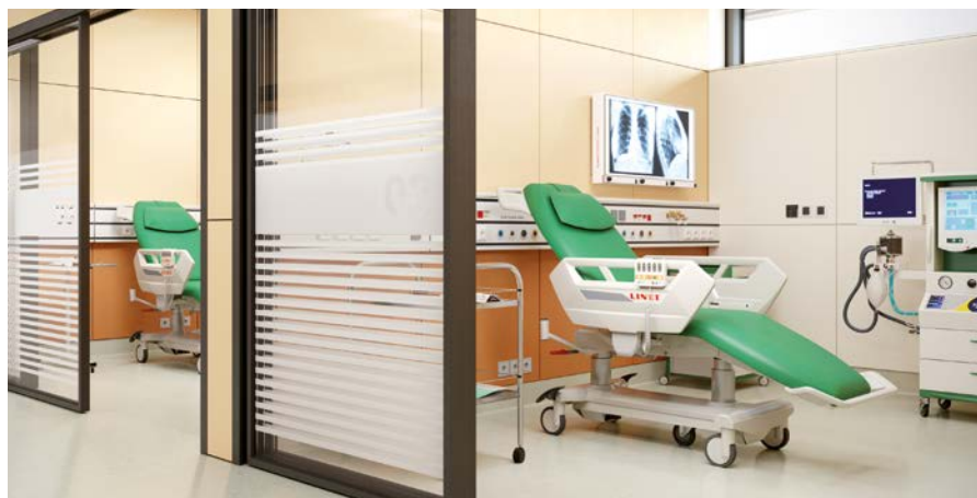
Pura pro jednodenní chirurgii

Sečteno a podtrženo, křeslo Pura je nový produkt, který díky promyšlenému konceptu a doladění všech detailů má nakročeno do nejrůznějších sfér ambulantní i rezidenční zdravotní péče.