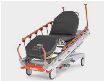
Zachraňuje životy, je rychlý, spolehlivý a přitom ještě dobře vypadá. To je Sprint 100, zatím poslední spolupráce LINETu a Ivana Dlabče.