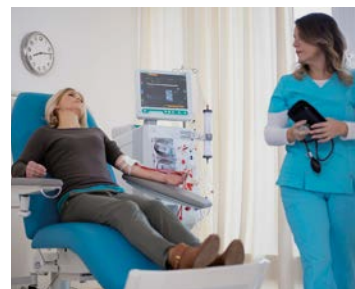
Komfortní a funkční křeslo pro déle trvající pobyt pacienta při dialýze.