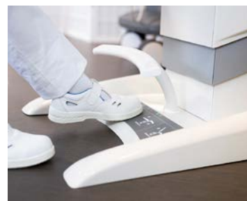
Nožní ovladače elektrického nastavení křesla fungují i na dálku, bezdrátově.