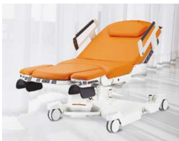
Důmyslné i krásné porodní lůžko AVE 2 poskytuje podporu při porodu a získává designové ceny.