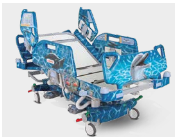
Multicare s motivy zvířecího světa je unikátní projekt LINETu a designéra Pavla Štátného pro dětské onkologické pacienty v Kataru.

nálními autorskými motivy ze zvířecí říše slouží v Kataru dětským pacientům v dlouhodobé péči trpícími leukémií a vzácnými genetickými poruchami. Lůžko Multicare v tomto provedení spojuje špičkový produkt se světem fantazie a umožňuje nemocnicím vytvořit unikátní interiéry pokojů šité na míru.