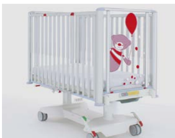
Průhledná čela dětského lůžka TOM 2 umožňují kontakt s okolím a zdobí je originální autorské potisky.