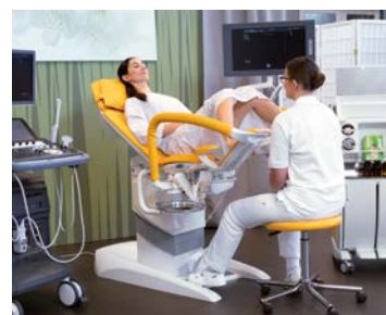
Gynekologická ordinace zahrnující křeslo s integrovaným kolposkopem, vozík a další příslušenství.

Křeslo je také vybaveno výsuvným manipulačním kolečkem, určeným pro pohyby v rámci ordinace. Pro co nejvyšší hygienické standardy je křeslo Gracie vybaveno antibakteriální koženkou, polstrování je bezešvé a hlavně odnímatelné. Vybrané části jsou navíc kryté PVC a nechybí ani integrovaná papírová rolka. Nadčasový design ordinace Gracie je možné vyladit do 15 barevných provedení.