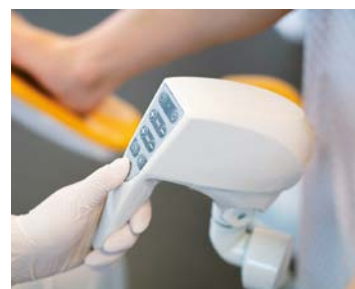
Full HD kolposkop integrovaný v křesle.

nahlídnout na intimní okamžiky nastávajících maminek, odvysílala televize Nova letos od srpna do října. Příběhy plné emocí, bolesti, slz i radosti se opět natáčely na gynekologicko-porodnické klinice Fakultní nemocnice Plzeň. Nemalou roli v Malých láskách opět sehrálo porodnické lůžko AVE, ale i další produkty z dílny LINET. Fanoušci seriálu se nemusí obávat, na účastníky čtvrté řady již probíhá casting, takže budou moci opět prožívat osudové chvíle s novými hrdinami. Seriály z lékařského prostředí jsou celkově divácky vysoce atraktivní a produkty LINET se v nich objevují často. Není divu, protože ve většině nemocničních zařízení se s „linetmi“ lůžky setkáváme – po celém Česku jich najdeme na 90 tisíc, přičemž oddělení intenzivní péče jsou standardně jejich největším odběratelem.