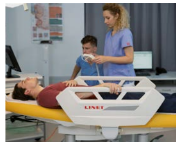
Pura je vhodná také pro vyšetření a jednoduché zákroky.