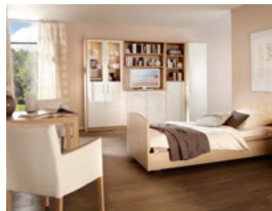
Dae lamus velest, ullorum, as minctur eribus sum aut magnam erupitat.