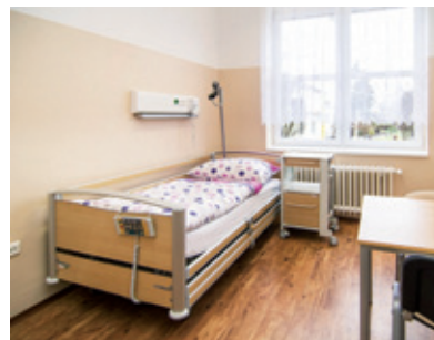
Základním vybavením pokojů jsou lůžka Altura Thema.