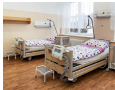
Některá lůžka jsou doplněna aktivní antidekubitní matrací Virtuoso.