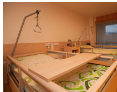
Pokoje jsou vybaveny komfortními lůžky Sentida.

Omnis as ipiet quid quissi cuscia verumquas etur aut eture cuptaec uptate qui aut rerio. Nam quid unt maxim sam, volor aut aut optatin et volorporit ea velicatur se moluptas ium que voluptium autet ressimus el id etur, ernam volori atur, inciet ad quiscidebit omnimod itatur sim et ium que esed qui rempero moluptur aut hicae susdam fuga. Ut utem entinve llandam, tenemporeri reptas Omnis as ipiet quid quissi cuscia verumquas etur aut eture cuptaec uptate qui aut rerio. Nam quid unt maxim sam, volor aut aut.