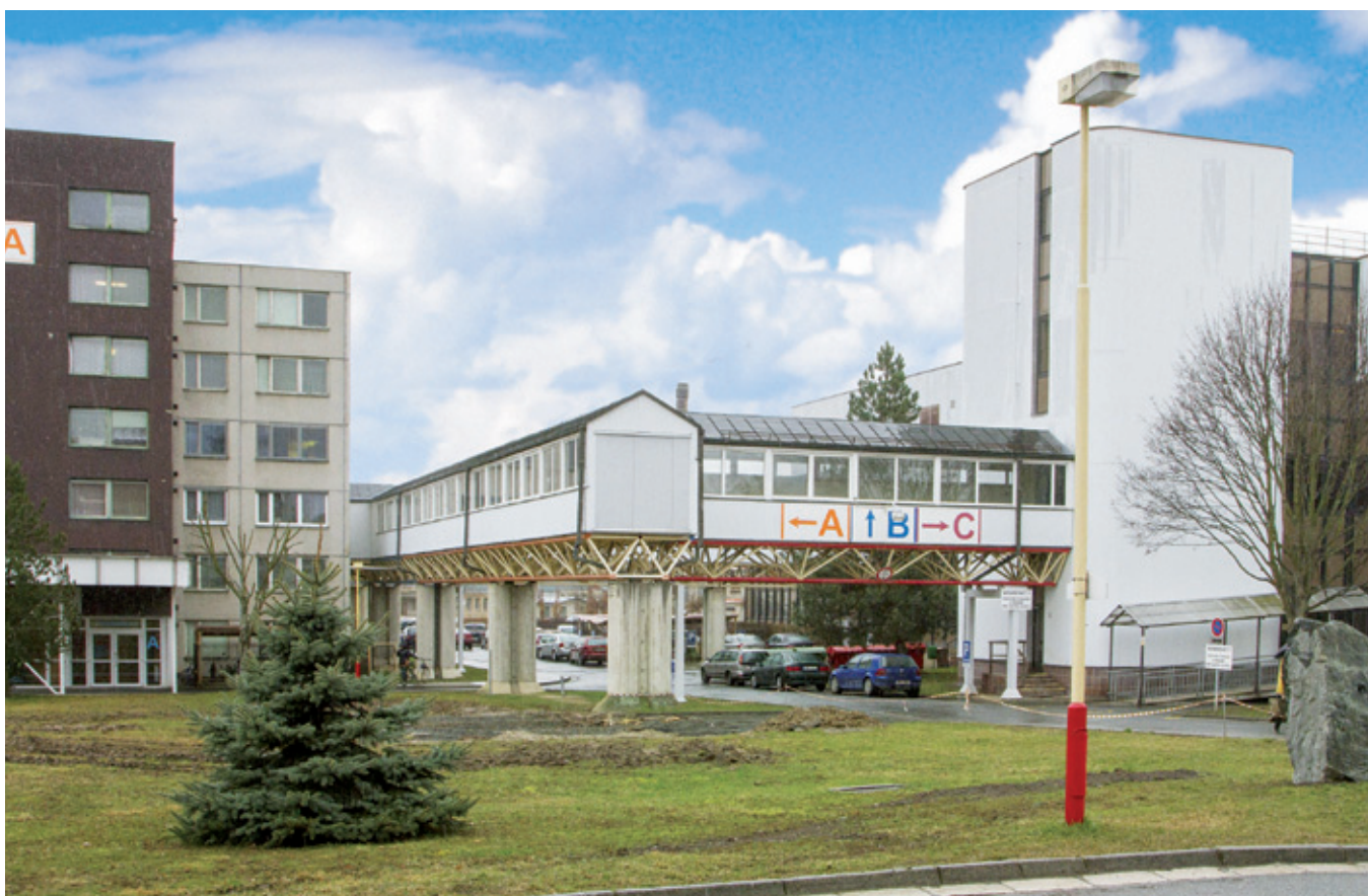
Slavnostní otevření oddělení sociálních lůžek proběhlo v březnu.