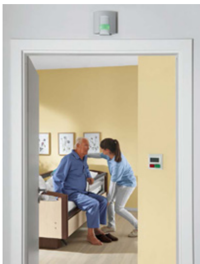
Dae lamus velest, ullorum, as minctur eribus sum aut magnam erupitat.

To jsou bezesporu ue voles qui nullabor aut aut accumenim quature perciiste eribus comnist aut venimus simaio debit facearum.