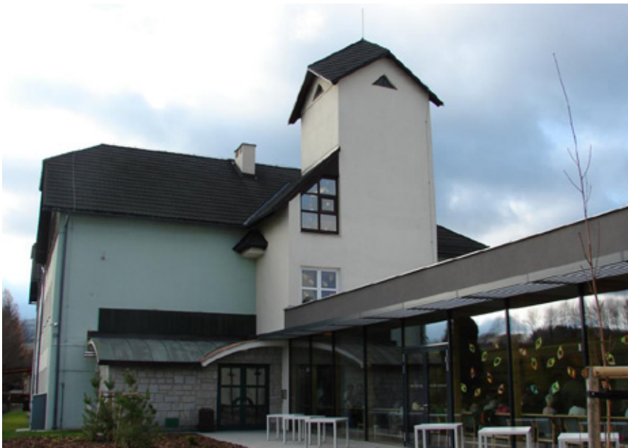
Moderní přístavba Domova pro seniory Jeseník

N a konci loňského roku dostaly sociální služby v Jeseníku zcela novou podobu. Zdejší obyvatelé najdou v nově otevřeném Centru sociálních služeb Jeseník nejen chráněné bydlení (stejně jako v někdejších Pensiónu pro seniory), ale také denní stacionář a především domov pro seniory vybavený moderními pečovatelskými lůžky Sentida.