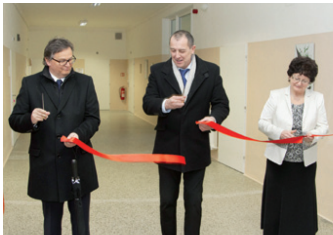
Slavnostní otevření oddělení sociálních lůžek proběhlo v březnu.

Nemocnice Šumperk , má za sebou bohatou historii, současnost naplněnou pozitivními změnami, které se promítají do stále rostoucí kvality péče naplněnou pozitivními změnami, které se promítají do stále rostoucí.