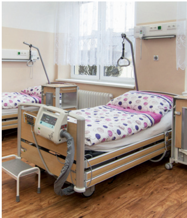
Některá lůžka jsou doplněna aktivní antidekubitní matrací Virtuoso.

Na skončenou rekonstrukci a zahájení provozu oddělení sociálních lůžek plynule navázala největší akce v novodobé historii nemocnice. V březnu byla zahájena stavba nového pavilonu, která je v současné době v plném proudu. A co bude výsledkem stavební horečky, která by měla kompletně