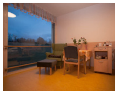
Důraz je kladen na přirozené světlo a propojení s přírodou.