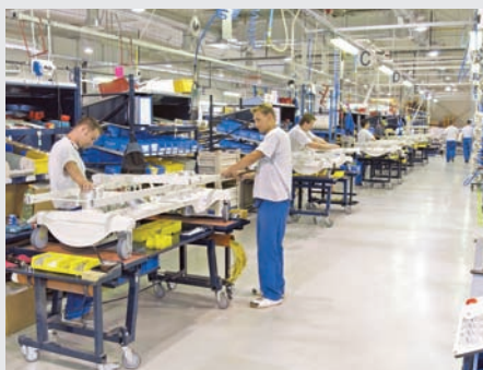
Montážní linka připomíná podobná pracoviště v automobilkách.