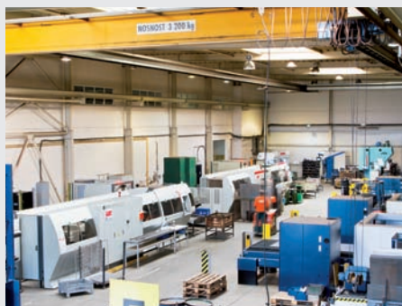
Inteligentní laserové pily a svařovací roboty zpracovávají hutní materiál.

dohled nad kvalitou všech polotovarů a také flexibilita. „Tato nezávislost nám umožňuje nejen ohlídat stanovené termíny, ale také pružně reagovat na speciální požadavky zákazníků,“ říká Jaroslav Chvojka, výrobní ředitel LINETu. „Do LINETu přivážíme pouze tři druhy vstupního materiálu – hutní materiál, jako jsou jekly, trubky a plechy, dále pak granulát pro výrobu plastových součástí a pak skupinu, kterou nazýváme katalogové zboží – spojovací materiál nebo elektromotory a kolečka,“ vypočítává. Z těchto tří „hromádek“ vznikají na ploše 25 tisíc m 2 sofistikovaná lůžka, která se naklánějí do stran, ovládají se pomocí dotykových displejů a jsou vybavená inteligentními automatickými funkcemi. Není divu, že je zapotřebí těch nejmodernějších výrobních strojů a technologií, školených pracovníků a perfektní organizace práce.