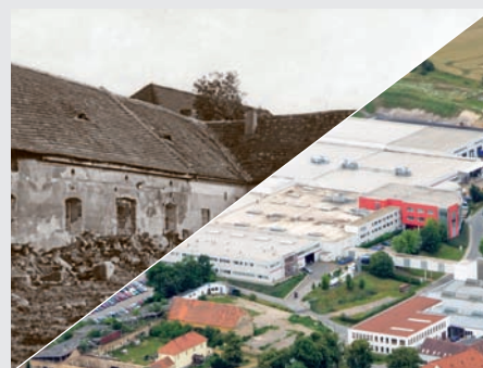
LINET v roce 1990 a v roce 2015.