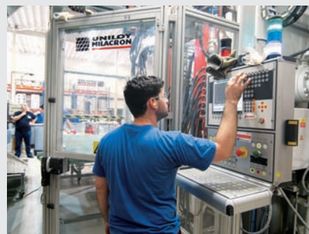
Chlouba LINETu – unikátní vyfukovačka plastových dílů.

Hlavní filosofií výroby a zároveň její unikátní charakteristikou je téměř absolutní samostatnost. To znamená, že si LINET veškeré komponenty, až na vzácné výjimky potvrzující toto pravidlo, vyrábí ve vlastní režii. Ačkoliv tato skutečnost je velice náročná na know how a vybavení, největší výhodou je