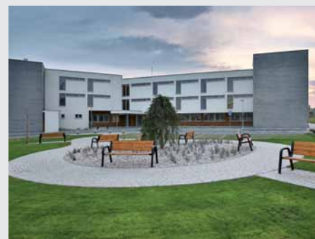
Pred domovom je dostatok priestoru na parkovanie.

rostlivosti. Do kvalitných zariadení býva zvyčajne problém sa dostať, poradovníky sú dlhé. „Stáva sa tak, že senior pobudne v jednom zariadení mesiac, potom sa presunie do iného, ale ani to nevyhovuje,“ vysvetľuje JUDr. Vaculík. Z neustáleho premiestňovania z domova do domova, prípadne každodenných obáv, prečo samostatne žijúca mamička, ktorá už dvakrát spadla, nedvíha telefón, plynie stres a starosti pre všetkých zainteresovaných.