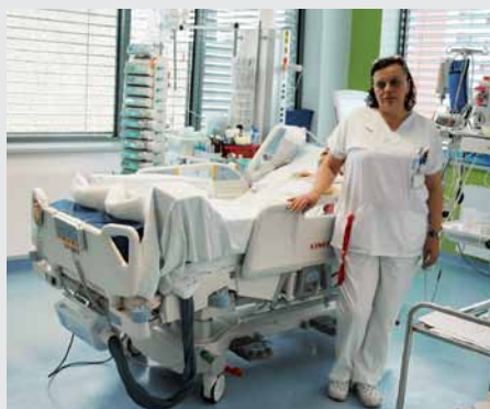
ARO a lůžka Multicare v Kladně obdivují zahraniční partneri LINETu.