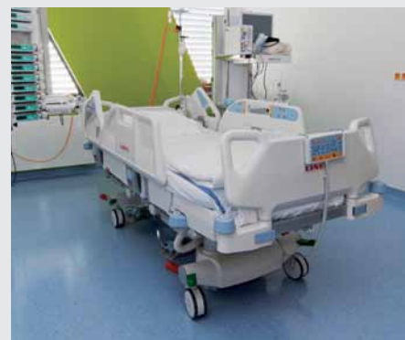
Oddělení ARO je kompletně vybavené lůžky Multicare.