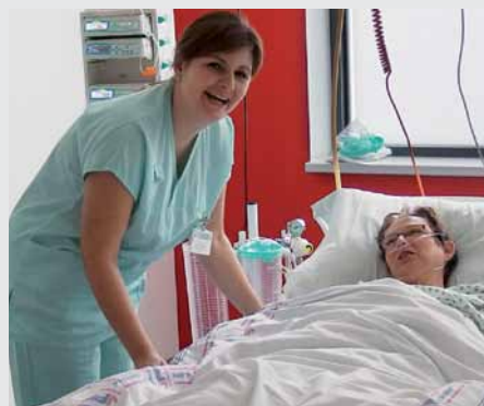
Sestry oceňují výškové nastavení, praktické postranice a další funkce.