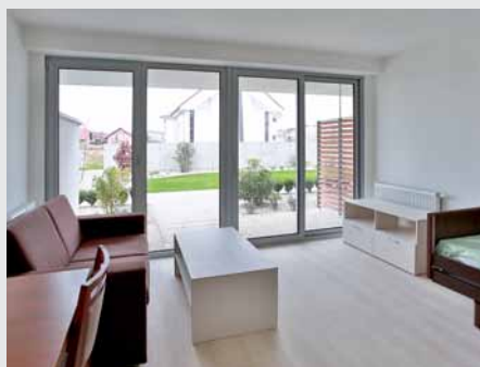
Z obývacej časti apartmánu sa dá vyjsť na balkón či do predzahradky.