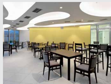
Reštaurácia bude prístupná klientom aj verejnosti.