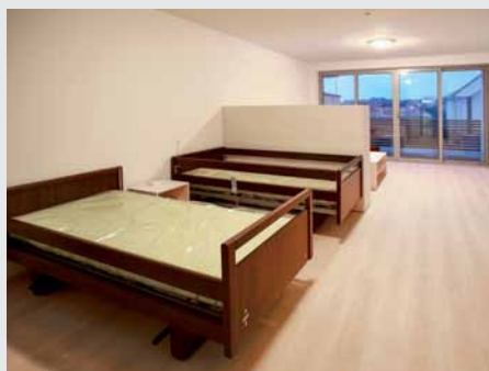
Elektricky polohovateľné lôžka Movita ponúkajú pohodlie aj bezpečie.