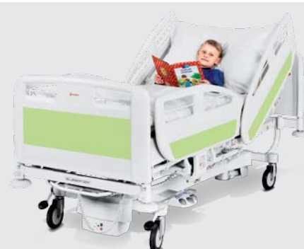
Univerzální lůžko Eleganza Smart Junior KIT je určené dětem i dospělým.