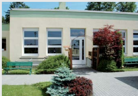
Terasa vybízí k odpočinku i zajímavým setkáním.