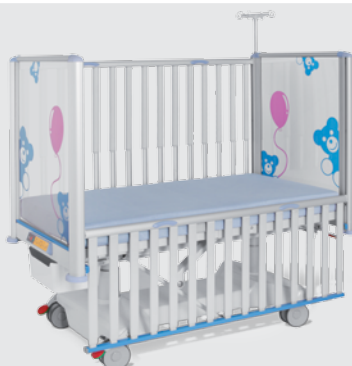
Letošní novinkou je pediatrické lůžko TOM 2 s elektrickým polohováním a teleskopickými postranicemi.