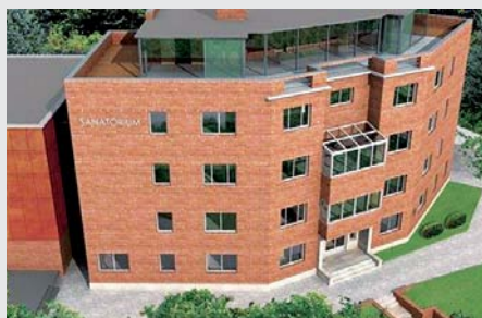
GPN KOCH Bratislava