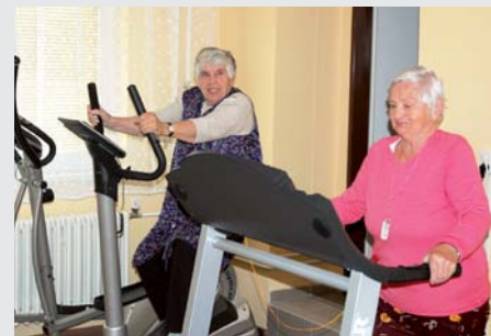
Na rotopedu a pohyblivém pásu jihlavští seniory našlapali stovky kilometrů.