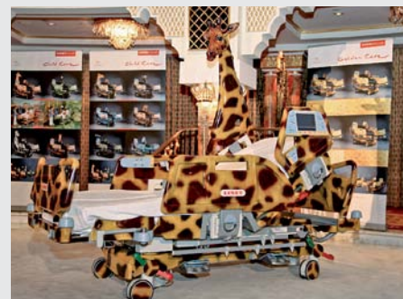
Nemocniční lůžko ve tvaru žirafy? Ano, je to možné nejen z hlediska designu, ale i funkčnosti.

Většina nemocnic respektuje Chartu práv dětí v nemocnici, která zaručuje dětem ohleduplné zacházení, již zmiňovanou přítomnost doprovodu v nemocnici nebo také možnost nosit vlastní oblečení a mít s sebou vlastní věci a hračky. Většina nemocnic se snaží dětská oddělení vybavit dětskými koutky, vyzdobit dět-