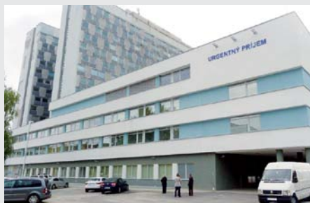
FN Banská Bystrica