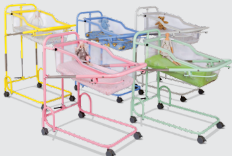
Novorozenecké postýlky MiMi jsou pro porodní péči v porodnicích i v domácím prostředí.