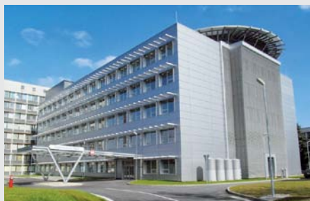
Nejnovější zakázka: pavilon urgentní medicíny ÚNLP Košice

Společnost Basco SK za 18 let působení na trhu měla postupně možnost dodat lůžka a nábytek do celé řady významných slovenských nemocnic i pečovatelských zařízení. Kromě jiného se podílela na zařizování všech nemocnic v rámci financování z fondů EU: SsÚSCH Banská Bystrica, FN sP Nové Zámky, FN Martin, FN Žilina, NsP Skalica, NsP Poprad, FN Banská Bystrica, FN Prešov, DFN Košice a FN Košice. Zatím poslední nejvýznamnější zakázkou byl pavilon urgentní medicíny v Košicích.