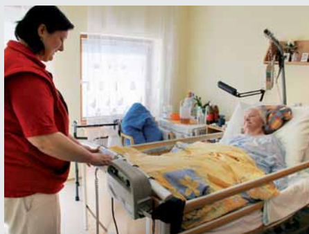
Spokojená klientka s ergoterapeutkou na lůžku Latera.