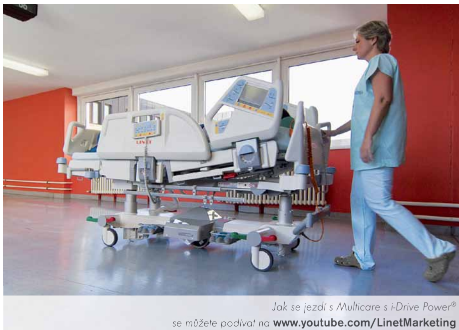
Jak se jezdí s Multicare s i-Drive Power® se můžete podívat na www.youtube.com/LinetMarketing

Ačkoliv jsou technologie LINETu zaměřené na transport různorodé, mají několik společných jmenovatelů, a to je například ergonomie ovládání, maximální možné snížení fyzické náročnosti a bezpečnost. Díky tomu přinášejí hmatatelný užitek v celém spektru nemocniční péče.