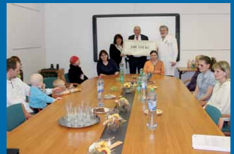
Slavnostní předání daru rodinám se uskutečnilo ve FN Motol v Praze.