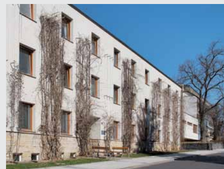
Domov pro seniory Pohoda v Turnově.

Zařízení, jehož zřizovatelem je město Turnov, disponuje 74 lůžky, z toho 42 funguje ve zvláštním režimu a 3 jsou určena pro odlehčovací pobytovou službu. Vedle těchto 3 pobytových služeb provozuje ještě centrum denních služeb Domovinka a terénní pečovatelskou službu. Celkem zde pracuje 85 zaměstnanců, kteří poskytují služby 450 seniorům. Spádovost domova zahrnuje pře-