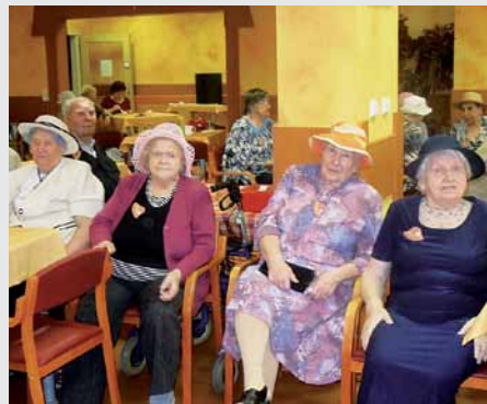
Společenské aktivity jsou zde mimořádně oblíbené.

2001. V současné době má domov kapacitu celkem 90 lůžek a k tomu 12 míst v denním stacionáři. Novinkou je registrovaná služba domov