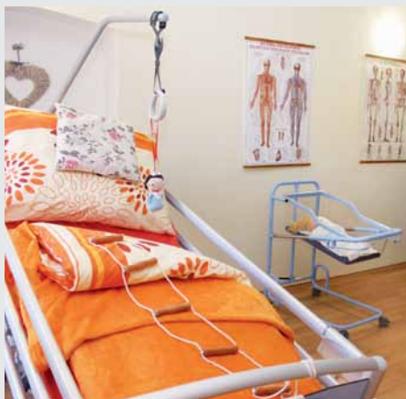
LINET zapůjčil lůžka Latera a Sentida pro výukové účely.

Akademie už má první zájemce o vzdělávání. První přihlášení jsou pracovníci těch zařízení, kteří spolupracovali při vytváření koncepce akademie, konkrétně jde o pečovatele ze Skalice, Hlohovce nebo Holíče. Na Slovensku podle Ondřeje Buzaly funguje přibližně 900 zařízení, která poskytují sociální služby různého zaměření. „Věříme, že je naše nabídka zaujme,“ dodal. Atraktivní bude také spolupráce s německými partnery. Díky ní budou mít slovenští pečovatelé možnost vyjet na pracovní stáže do prostředí německých sociálních služeb a získat tam nové zkušenosti a podněty. Další aktivitou zástupců akademie je příprava vyhlášení cen kvality ministra sociálních věcí a rodiny ve spolupráci s ministerstvem a Národním programem kvality SR.