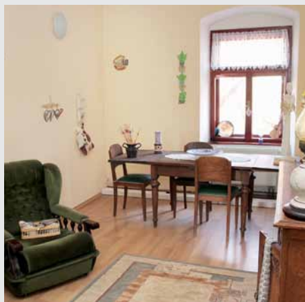
Pro studijní účely byla vytvořena modelová reminiscenční místnost.

Slavnostní otevření akademie se uskutečnilo pod záštitou ministra sociálních věcí a rodiny Slovenské republiky a zúčastnili se ho hosté z řad slovenské odborné veřejnosti a zahraniční partneři z Německa a České republiky. Vzdělávací centrum sídlí v historických prostorech holíčské manufaktury známé jako Beseda. Kromě klasických poslucháren tu naleznete místnosti pro skutečně praktickou výuku například rehabilitace. Je tu také reminiscenční místnost nebo pokoje s lůžky LINET, kde si mohou účastníci kurzů pod vedením zkušených lektorů přímo vyzkoušet nově nabyté znalosti. Více informací o kurzech a dalších aktivitách Akademie vzdělávání a výzkumu v sociálních službách najdete na www.tabitasro.sk .