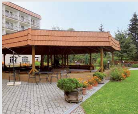
Dům Kněžny Emmy funguje od roku 2001.

Dům Kněžny Emmy – domov pro seniory se nachází na jižním okraji Neratovic. Do novostavby domova se první klienti stěhovali v roce