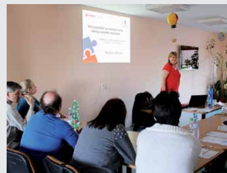
Účastnice kurzu LINET Scholaris na školení přímo v domově.