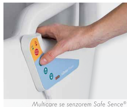
Multicare se senzorem Safe Sense®

Kolečko i-Drive Power® má vlastní pohon elektromotorem a pomáhá lůžko uvést do pohybu a následně ulehčuje samotný transport. Navíc se umí inteligentně přizpůsobit terénu v nemocnicích i konkrétním situacím, především optimalizuje podle potřeby rychlost jízdy. Jeho dva režimy optimalizují rychlost jízdy podle vnějších podmínek. Režim zrychlení dynamicky pomáhá zkrátit délku trvání transportu během delších a rovných tras. Režim jízdy vpřed optimalizuje rychlost pohybu pro průjezd místy s nedostatkem prostoru, kde je zapotřebí manipulovat velmi obratně a opatrně, tak aby bylo minimalizováno riziko nehod a kolizí. K dispozici je také volný režim, který umožňuje manipulovat s lůžkem snadno bez podpory elektromotoru.