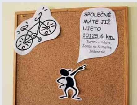
Společně ušlapané kilometry.