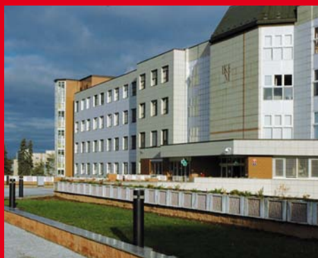
Součástí IKEM v Praze je také Klinika nefrologie, zaměřená na pacienty s onemocněním ledvin.

Vzhledem k tomu, že dialýza trvá čtyři až pět hodin, je pro pacienty velká výhoda, že si lůžko mohou napolohovat podle své momentální potřeby a pro svoje pohodlí. V neposlední řadě musím také zmínit barevná čela lůžek. Krásně nám ladí s barvou stěn a vytvářejí nejen pro nás pěkné pracovní prostředí, ale zcela určitě působí pozitivně na pacienty, kteří tu tráví docela podstatnou část dne.