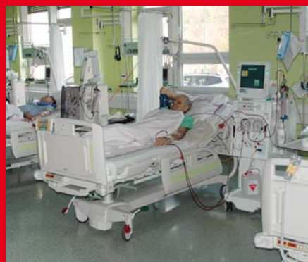
Na oddělení dialýzy je pro pacienty k dispozici 6 lůžek Eleganza 3XC s vázicím systémem.