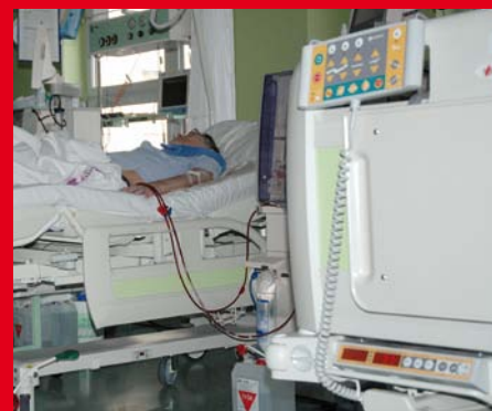
Pomocí váhy na lůžkách pacienta sestra zváží a nastaví odpovídající množství tekutiny pro dialýzu.